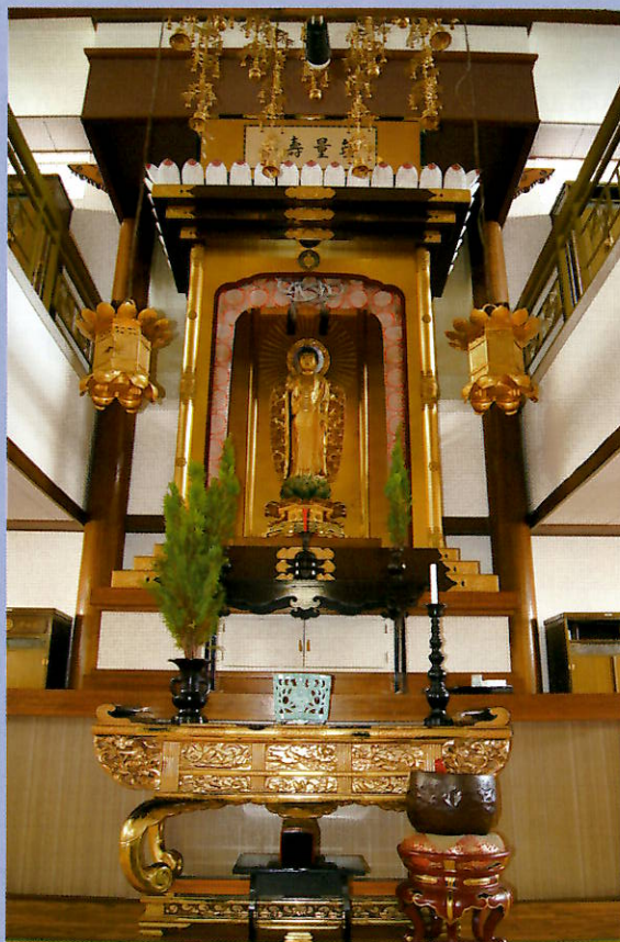
阿弥陀如来（無量寿閣1階）