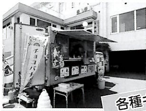
各種キッチンカー販売