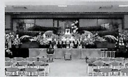
▶会館ホール (二〇〇名まで対応可)