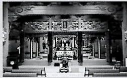
▶本堂 (二〇〇名まで対応可)