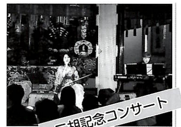
二胡記念コンサート

※チャンネル登録していただくと配信方法が楽になります。まずは 50 人目指します。