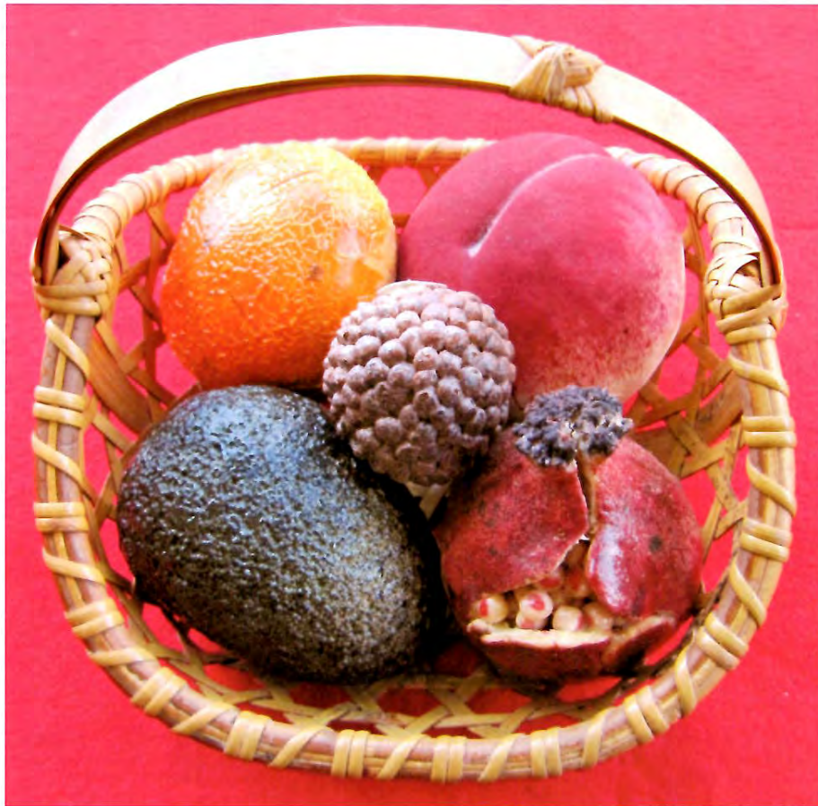
生菓子 果物盛り合わせ