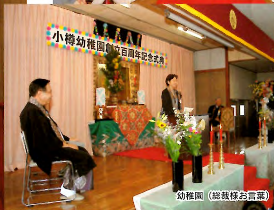
幼稚園（総裁様お言葉）