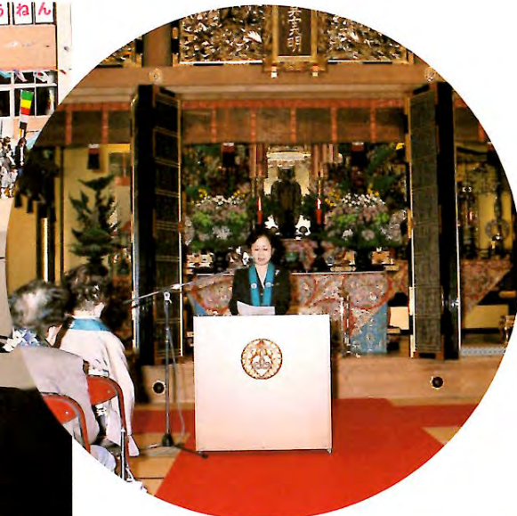
仏婦（総裁様お言葉）