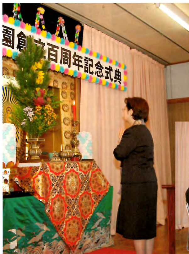
幼稚園（総裁様お焼香）