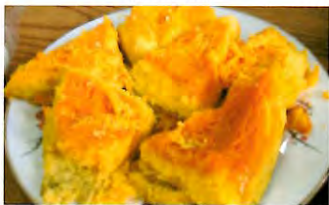
奥沢名物のカボチャ