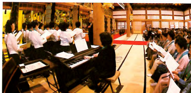
仏婦（音楽法要コーラス）