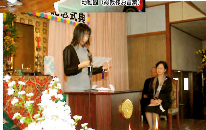
幼稚園（佐々木父母の会会長謝辞）