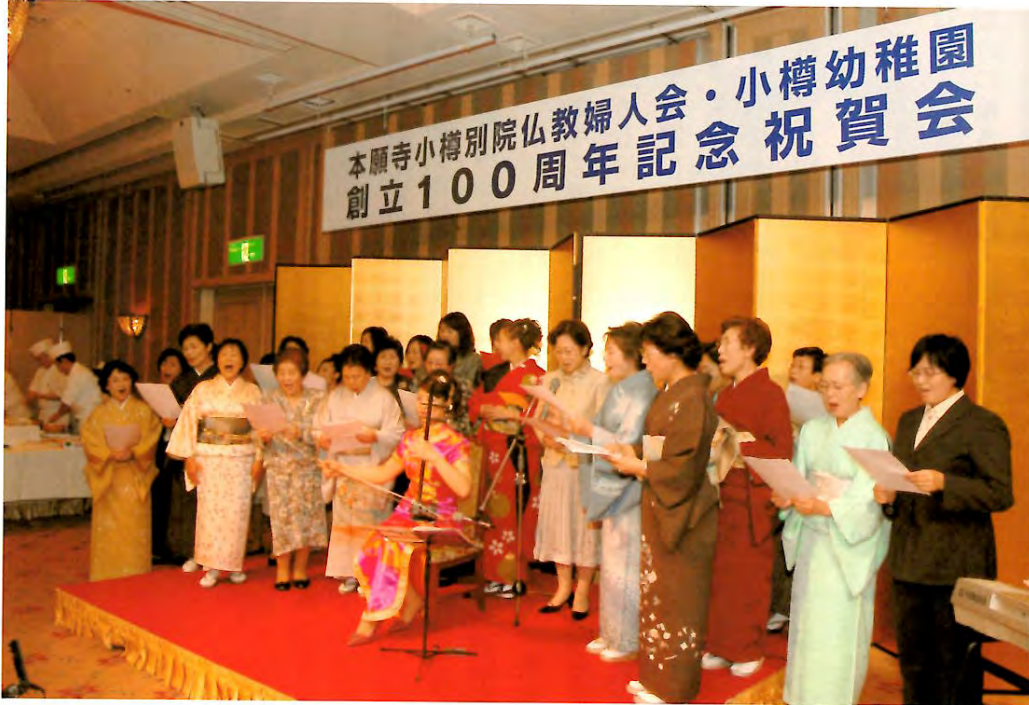
祝賀会（二胡演奏での合唱）