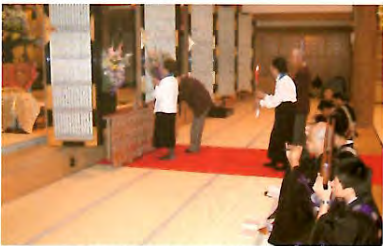
仏士・仏婦報恩講（献華・献灯）