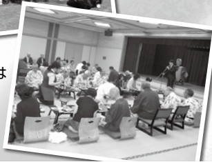
もちろん夜は宴会です