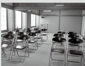
▶小会場もございます（20名程度）