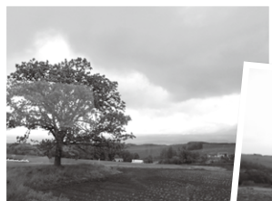
美瑛などの雄大な景色