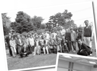
男山酒造館にて記念撮影

昔、修学旅行で層雲峡を観光された方もいらっしゃると思いますが、いざ訪れてみると、層雲峡の雄大な景色を見逃すまいとバスガイドさんの解説を聞きつつ、風景に見入っていたお姿がとても印象的でした。