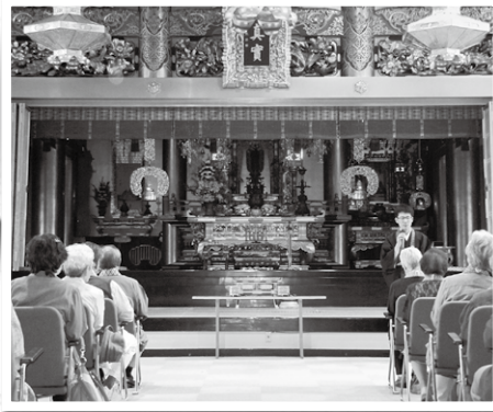
札幌別院でのお参り