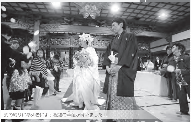
式の終りに参列者により祝福の華葩が舞いました