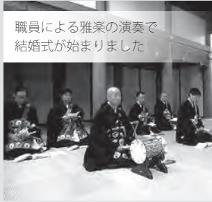
職員による雅楽の演奏で結婚式が始まりました