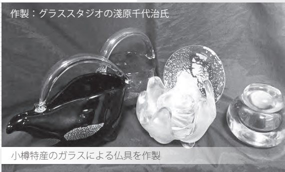
作製：グラススタジオの浅原千代治氏