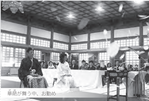
華葩が舞う中、お勤め