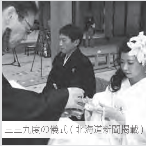
三三九度の儀式（北海道新聞掲載）