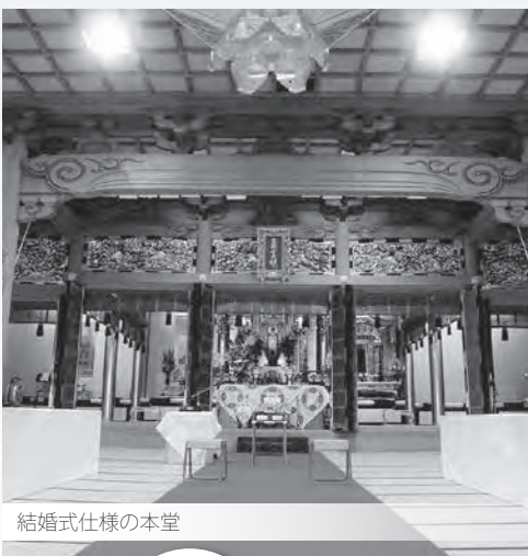
結婚式仕様の本堂