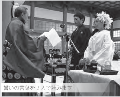
誓いの言葉を2人で読みます