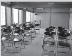
小会場もございます（20名程度）